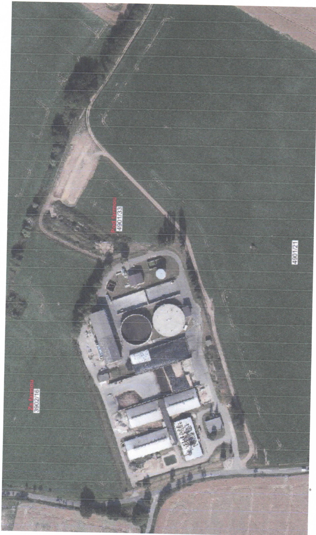
Pole Pod farmou 0,68 ha – u bioplynové stanice