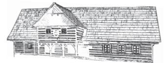
Památník – rodný dům Václava Hanky