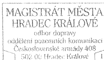
Otisk úředního razítka

referent silničního správního úřadu oprávněná úřední osoba